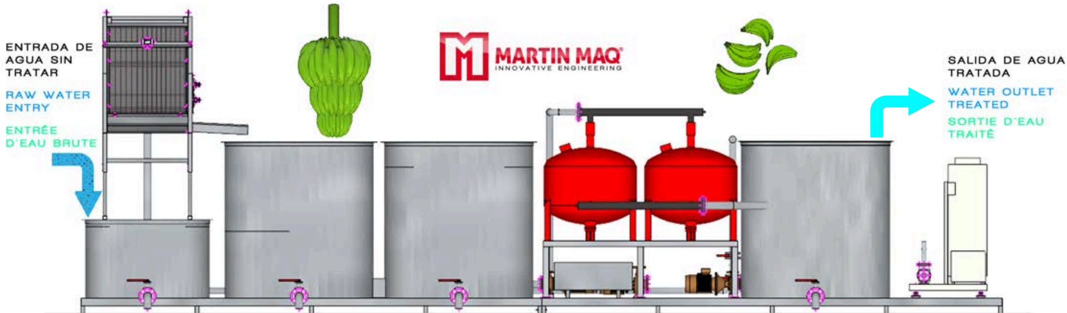
PLANTA DE FILTRADO, DECANTACIÓN, ELIMINACIÓN Y DESTRUCCIÓN DE LATEX DEL AGUA PROCEDENTE DEL LAVADO DE FRUTA ®

PLANT FOR FILTERING, DECANTING, ELIMINATION AND DESTRUCTION OF LATEX IN WATER FROM WASHING FRUIT ® INSTALLATION DE FILTRAGE, DÉCANTATION, ÉLIMINATION ET DESTRUCTION DU LATEX D'EAU DE LAVAGE DES FRUITS ®